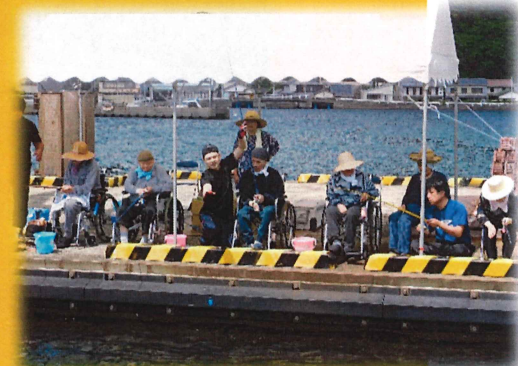
レクリエーション活動: 施設外活動も行っています。