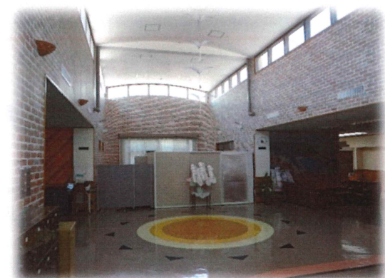
玄関ホール: ゆったりとした空間でお迎えます。