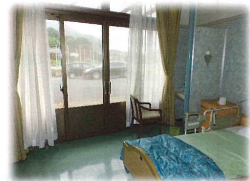
居室(個室): 日当たりもよく、落ち着いて過ごせる空間 となっています。この他にも多床室を備え ています。